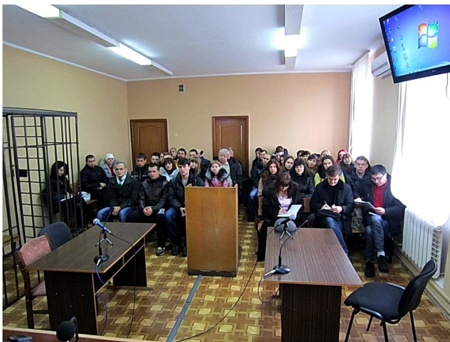
На фото: студенти факультету правознавства ДВНЗ «Олександрійський політехнічний коледж», представники міських громадських організацій та місцевих ЗМІ