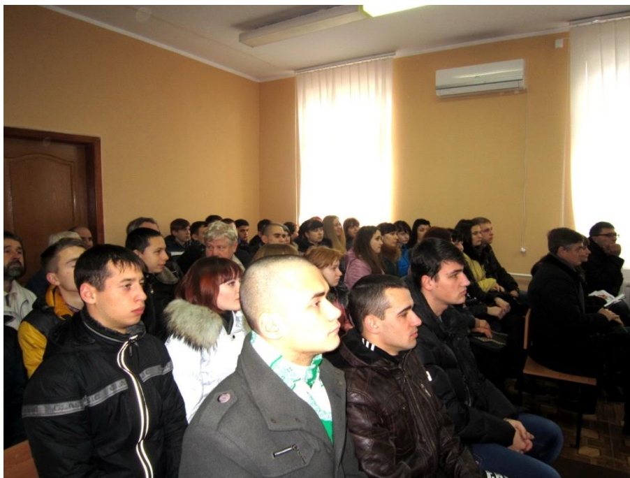
На фото: студенти факультету правознавства ДВНЗ «Олександрійський політехнічний коледж», представники міських громадських організацій та місцевих ЗМІ