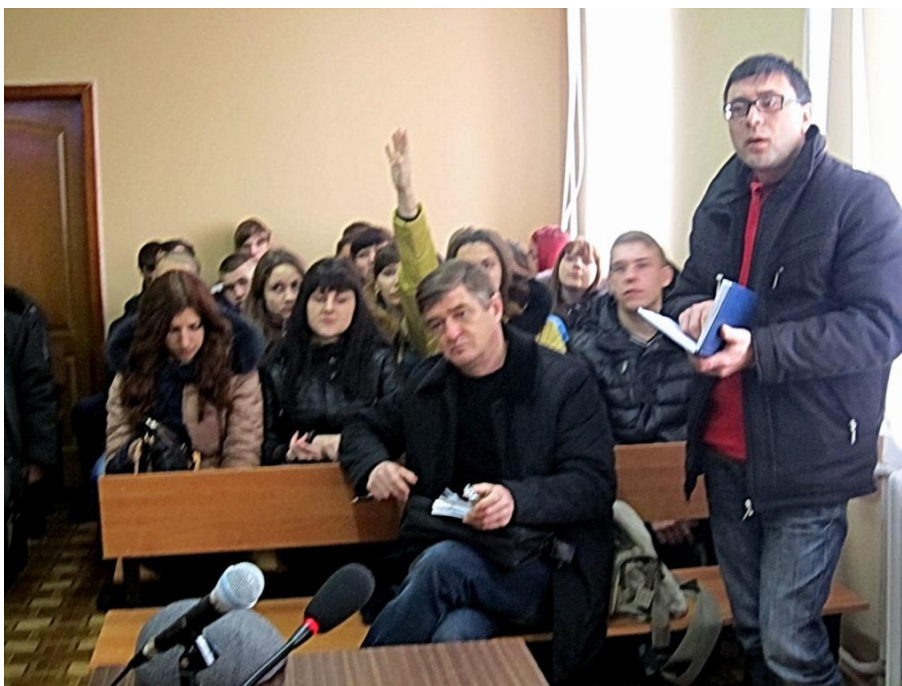
На фото: представники місцевих ЗМІ та студенти факультету правознавства ДВНЗ «Олександрійський політехнічний коледж»